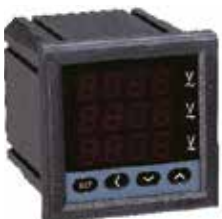
PA/PZ7777-S Трехфазный цифровой амперметр, вольтметр