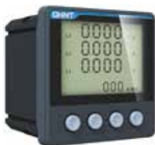
PD666-S3 Трехфазный многофункциональный измеритель с ЖК-дисплеем