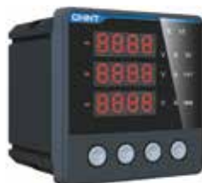
PD666-S4 Трехфазный цифровой многофункциональный измеритель